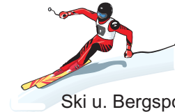
Ski u. Bergsport